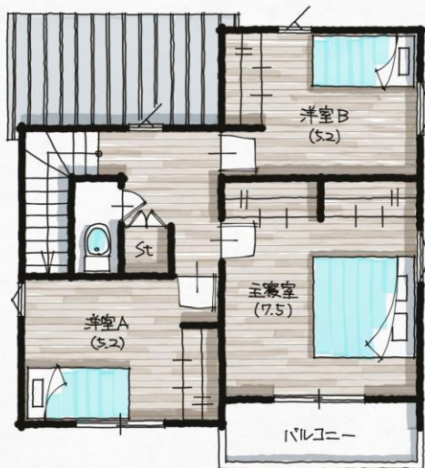
2nd Floor Plan