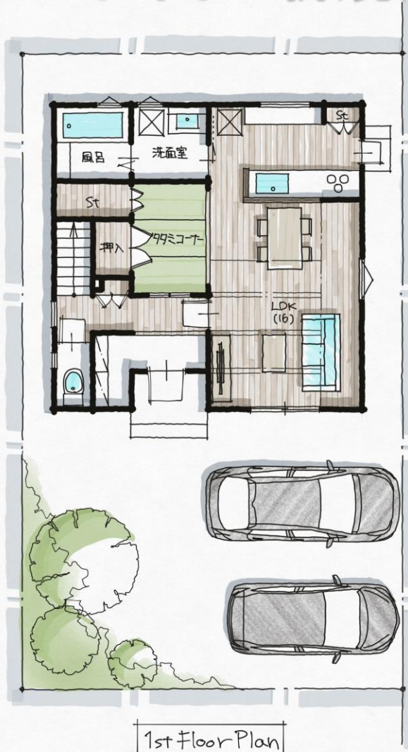
1st Floor Plan