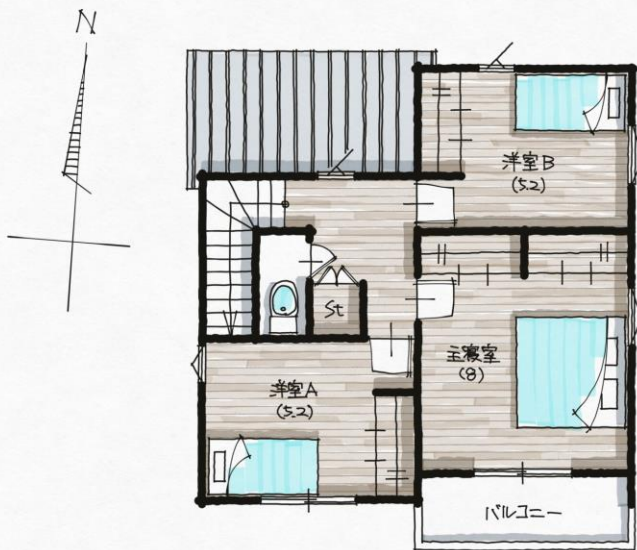
2nd Floor Plan